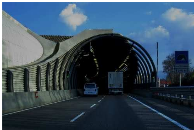
Fig. 1: imbocco galleria lavoro ultimato