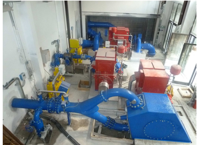
Fig.1: centrale idroelettrica